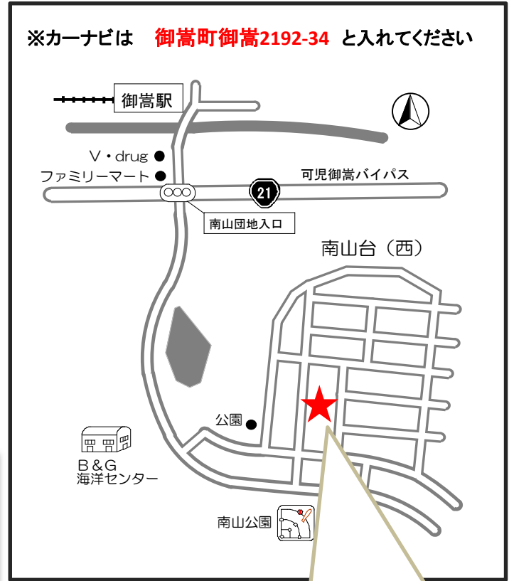
こちらの建物です